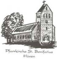
Pfarrkirche St. Bonifatius Hüven