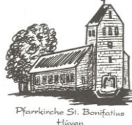
Pfarrkirche St. Bonifatius Hüven