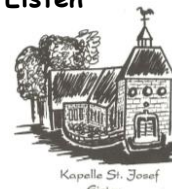
Kapelle St. Josef Eisten