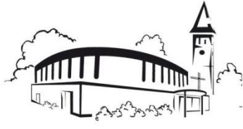
Werpeloh St. Franziskus