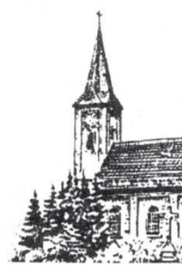
Stavern St. Michael