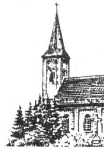
Stavern St. Michael