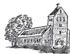
Hüven St. Bonifatius