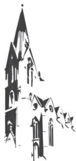
Sögel St. Jakobus