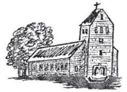
Hüven St. Bonifatius