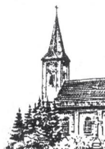
Stavern St. Michael