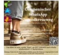
Jugendkreuzweg 2021 WhatsApp Kontakt

Das katholische Jugendbüro und der BDKJ Regionalverband Emsland-Nord organisieren einen Jugendkreuzweg im WhatsApp-Format. Die Gedankenanstöße, die wöchentlich vom 17. Februar bis 04. April 2021 verschickt werden, sind angelehnt an die traditionellen Kreuzwegstationen und werden von Jugendlichen aus dem Dekanat mit Videos, Liedern, Bildern oder Geschichten gestaltet und laden ein, einen kurzen Moment innezuhalten. Anmelden können sich alle Jugendlichen und Interessierten, indem sie eine Nachricht mit „Start“ an die Nummer 0157 33664611 schicken und diese im eigenen Adressbuch speichern.