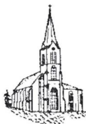
Spahnharrenstätte St. Johannes der Täufer