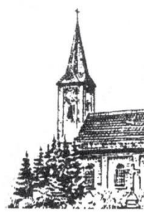
Stavern St. Michael