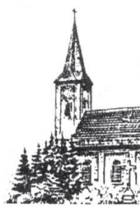
Stavern St. Michael